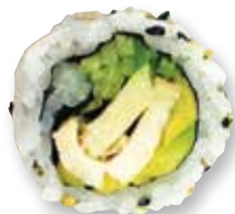
Kylling teriyaki roll