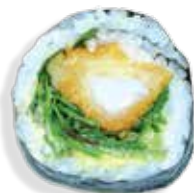
Store ebi tempura