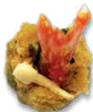
Stor crispy roll