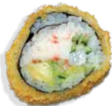
Store scallop tempura