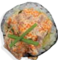
Store laks tatar