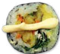
Stor crispy kakiyaki