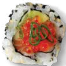
Snow crab roll