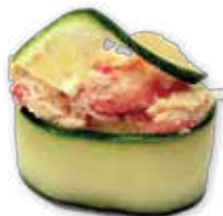
Gukan snow crab