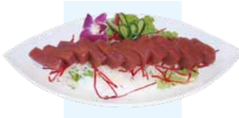
701. Sashimi Maguro Thunfisch ( tuna )