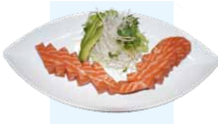
700. Sashimi Sake Lachs ( salmon )