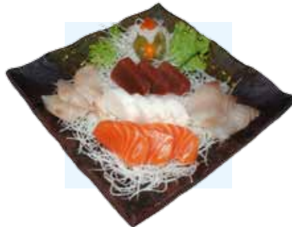
702. Sashimi Moriavase verschiedene Rohfischfilets ( different raw fish )