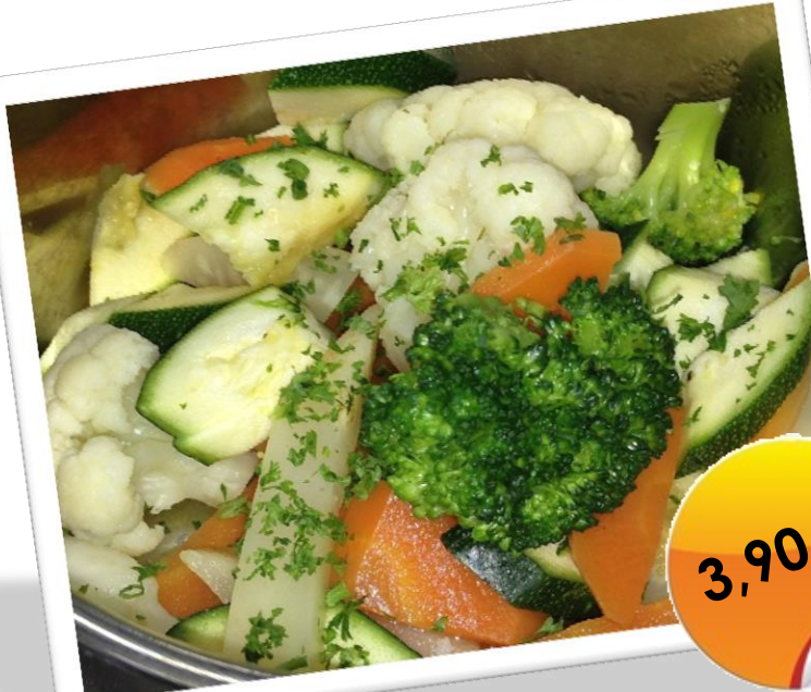
Frisches Marktgemüse der Saison