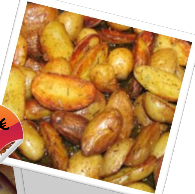
Toskana- Kartoffeln Lecker geröstete Drillinge mit Kräutern