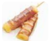
Y5 Cheese Yaki (Bœuf au fromage) 4.20€