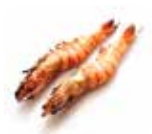
Y7 Ebi (Gambas) 5.50€