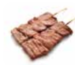
Y4 Gyuniku (Bœuf) 4.00€