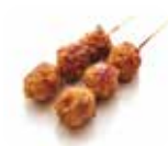
Y2 Tsukune (Boulettes de poulet) 3.80€