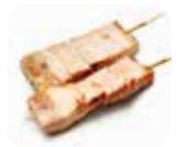
Y11 Maguro (Thon) 5.00€