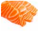
SA1 Shake (Saumon) 8.50€