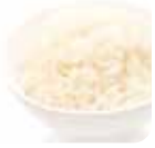
A1 Gohan (Riz nature) 2.00€