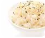
A3 Riz vinaigré 2.80€