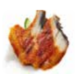
SA6 Unagi (Anguille) 9.50€