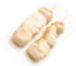
Y8 Hotate (Coquille Saint-Jacques) 5.50€