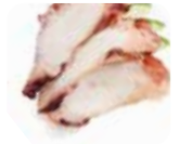
SA5 Tako (Poulpe) 9.00€