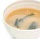
A4 Soupe Miso (Tofu, algues, poireaux, champignon) 2.50€