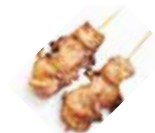
Y3 Teba (Aile de poulet) 3.80€