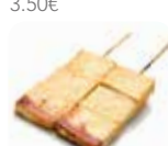
Y13 Tofu (pois fermenté) 3.50€