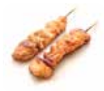
Y1 Syoniku (Poulet) 3.80€