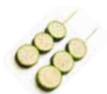
Y12 Courgette 3.50€