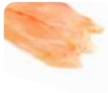
SA3 Tai (Daurade) 9.00€