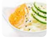
A5 Salade japonaise (A base de chou blanc assaisonné) 2.50€