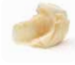
A2 Gingembre 1.80€