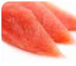
SA2 Maguro (Thon) 9.50€