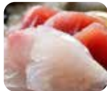
SA7 Assortiment de sashimi (12 pièces) 11.00€