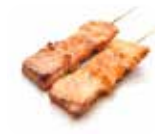
Y9 Shake Yaki (Saumon) 4.80€