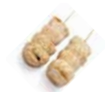
Y10 Kinoko (Champignon) 3.50€